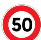
BK14 - 50 KM/H