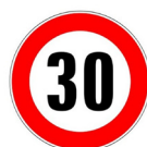
BK14 - 30 KM/H